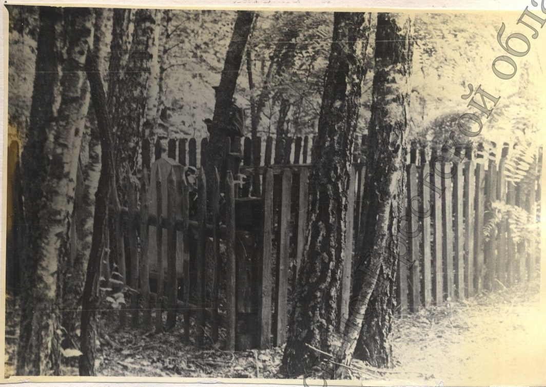
Вид захоронения расстрелянных карателями мирных граждан на бывшем хуторе Котловского на Раховичских хуторах.