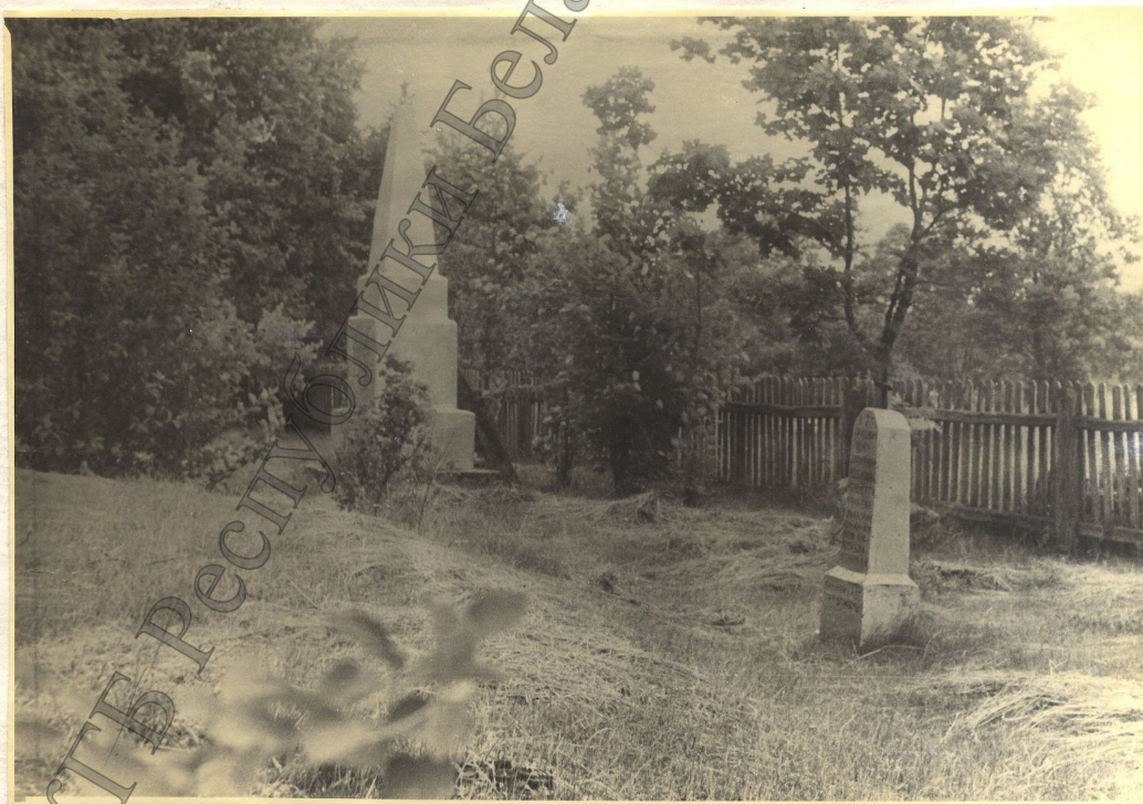
Вид могил и памятника на месте захоронения расстрелянных карателями 16 февраля 1943 года мирных граждан деревни Копацевичи.

Ст. следователь следотделения УНГВ при СМ ВССР по Брестской области майор /В