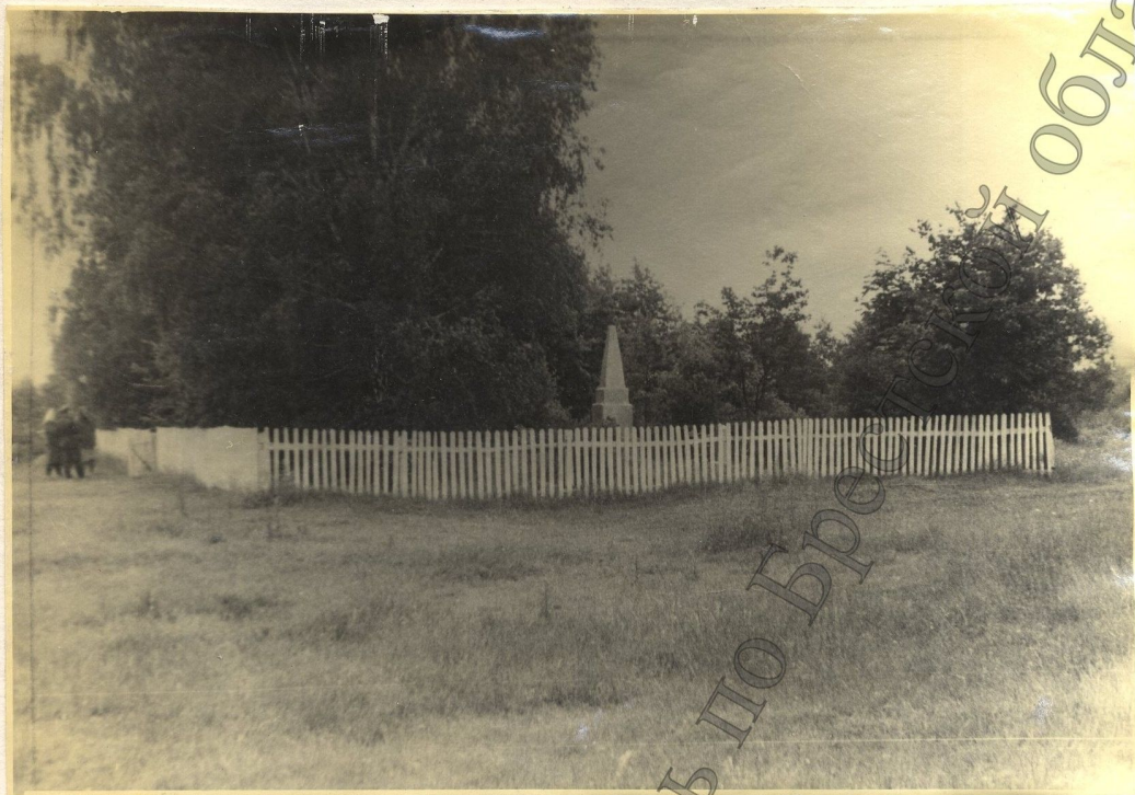
Общий вид места захоронения расстрелянных карателями 16 февраля 1943 года мирных граждан деревни Копацевичи.

Приложение к протоколу осмотра от 24 июня 1971 года с участием свидетеля Л. В. Д.